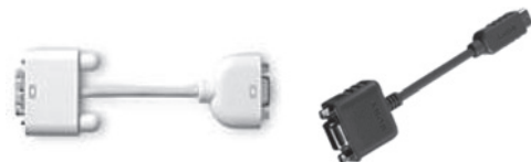
外部出力用変換ケーブル